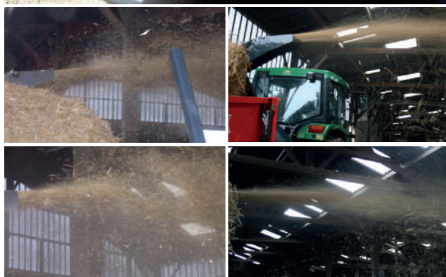
PAILLAGE SANS L'AÉROLIB PAILLAGE AVEC L'AÉROLIB